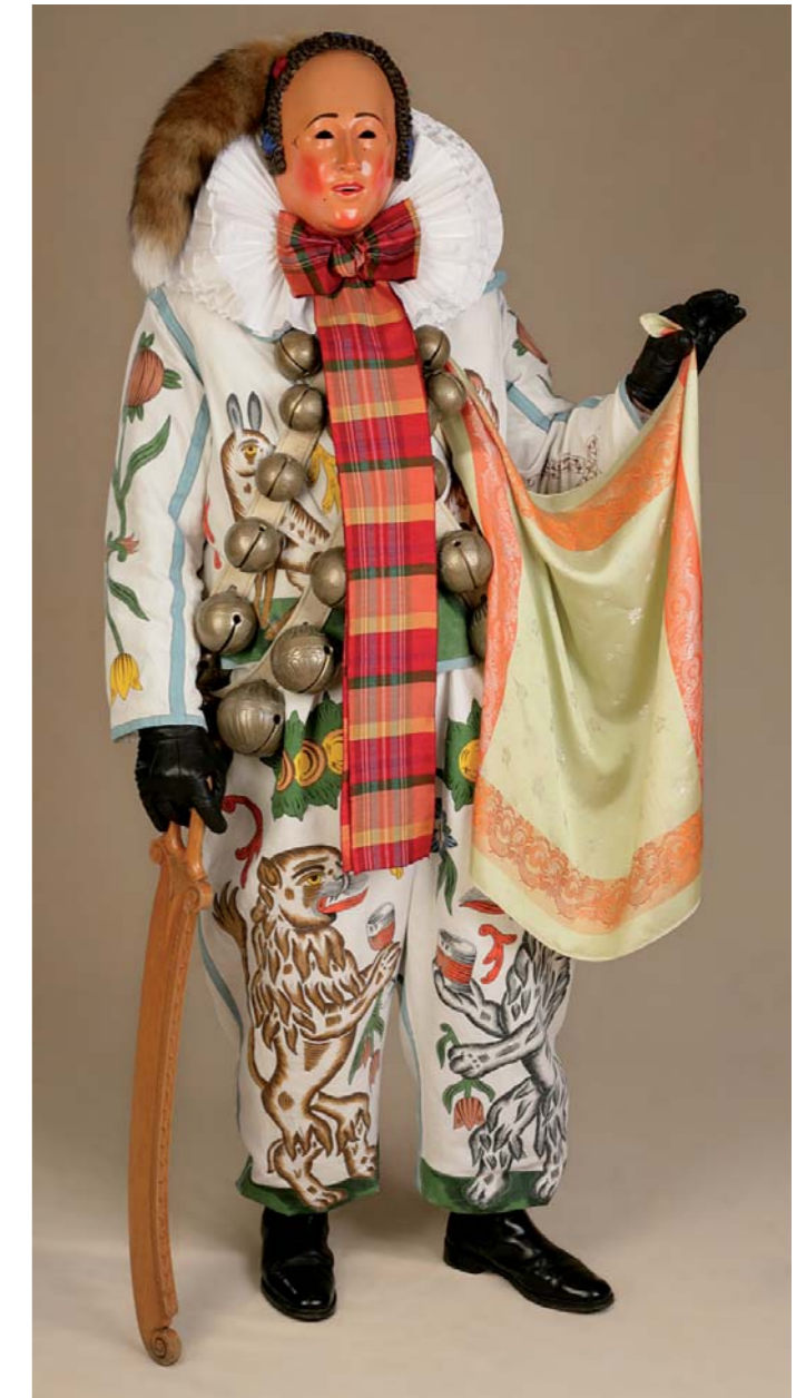
De Villingen Narro